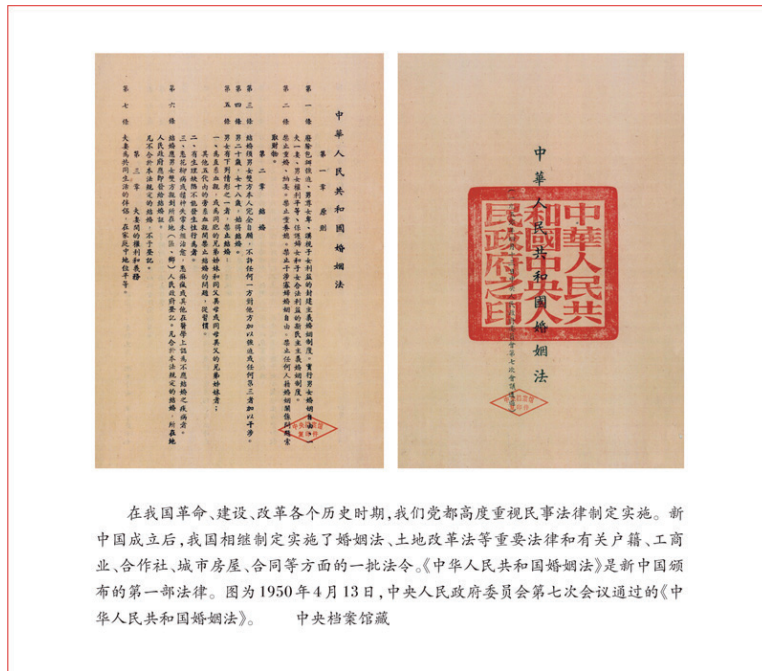
在我国革命、建设、改革各个历史时期,我们党都高度重视民事法律制定实施。新中国成立后,我国相继制定实施了婚姻法、土地改革法等重要法律和有关户籍、工商业、合作社、城市房屋、合同等方面的一批法令。《中华人民共和国婚姻法》是新中国颁布的第一部法律。图为1950年4月13日,中央人民政府委员会第七次会议通过的《中华人民共和国婚姻法》。

统一民事法律适用标准。要加强涉及财产权保护、人格权保护、知识产权保护、生态环境保护等重点领域的民事审判工作和监督指导工作，及时回应社会关切。要加强民事检察工作，加强对司法活动的监督，畅通司法救济渠道，保护公民、法人和其他组织合法权益，坚决防止以刑事案件名义插手民事纠纷、经济纠纷。