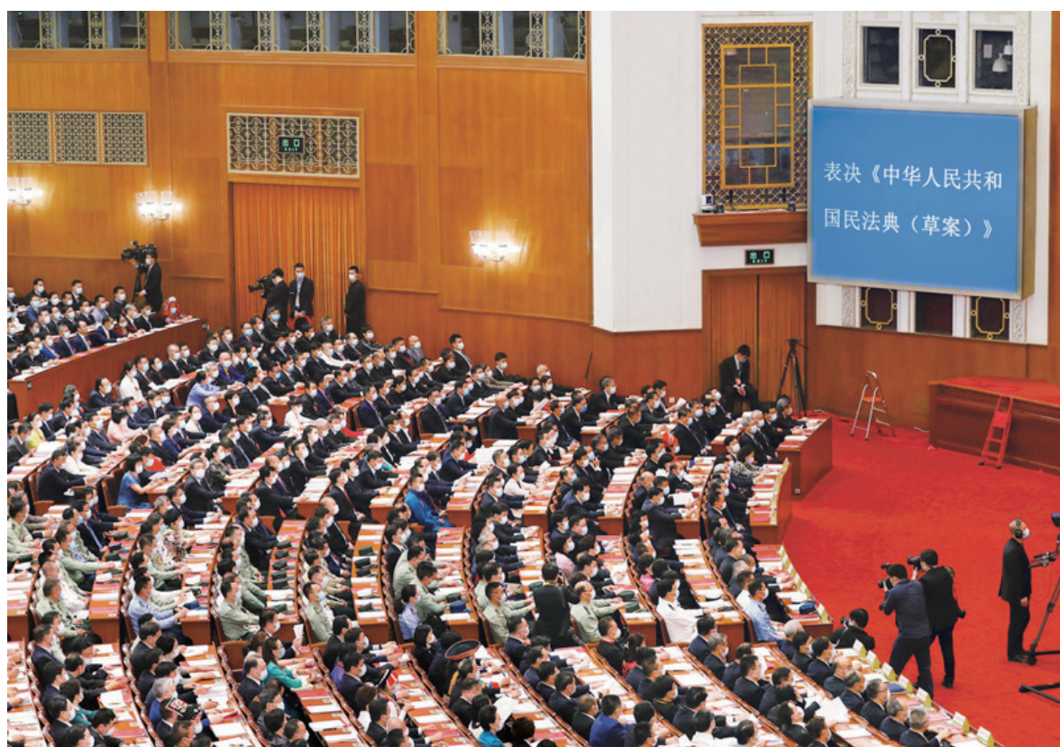
2020年5月28日，第十三届全国人民代表大会第三次会议在北京人民大会堂闭幕。

第二，加强民事立法相关工作。民法典颁布实施，并不意味着一劳永逸解决了民事法治建设的所有问题，仍然有许多问题需要在实践中检验、探索，还需要不断配套、补充、细化。